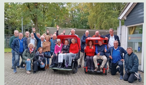
Inspiratie dag Deventer 2024