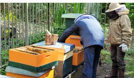
Imkers aan het werk

Leerzaam voor ons en voor de passagiers.